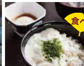
農産物直売所(上) 軽食「めくもり亭」麦とろご飯(下)