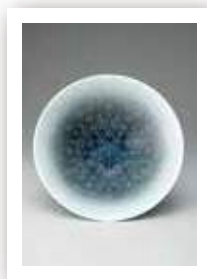
特別展 色絵薄墨墨はじき雪文鉢 十四代今泉今右衛門 2011年(個人蔵)

10月21日(土) 11時より(本展観覧券が必要です) 当館学芸員が展覧会の見どころを説明します。