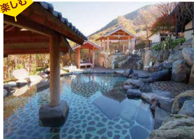
自然豊かな露天風呂